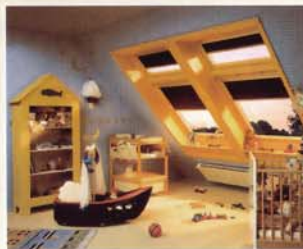
Das Kinderzimmer unter dem Dach