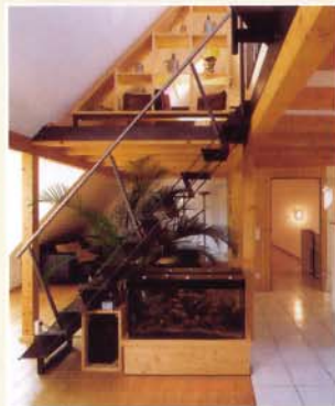
Der alte Dachboden ...