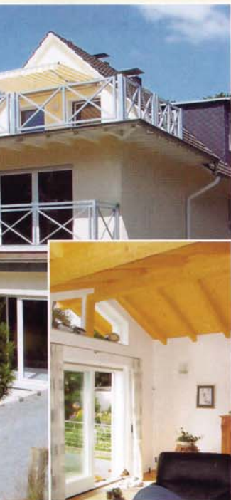
lt durch Aufstockung und Anbau

Modernisierung , die wir mit en! Aus einer Hand, koordiniert ieb.