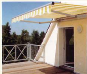
Himmlische Ruhe auf der Dachterrasse

Aber der Staat fordert nicht nur, er gibt auch Fördergelder für energetisch wirksame Modernisierungsmaßnahmen. Das rechnet sich dann besonders, wenn ohnehin Repara- turen am Haus erforderlich sind und die Maßnahmen zu einem Paket geschnürt werden: der Mehrwert-Modernisierung .