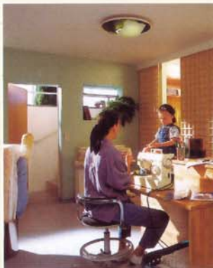
Endlich, der Hausarbeitsraum im ausgebauten Keller